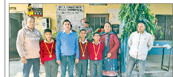
तरावड़ी। विजेता बच्चों को मेडल पहनाने हुये स्कूल प्रधानाचार्य व स्टाफ।

करनाल। जिला नगर योजनाकार गुंजन के निदेश पर बुधवार को पुलिस बल व इस्ट्रीट मैजिस्ट्रेट की मौजूदगी में दो अवैध कॉलोनियों पर तोड़फोड़ करवाई की गई। पहली कॉलोनी गाँव गौंदर के पास बस आड़े के निकट 5.5 एकड़ में थी, जहाँ छह डीपीसी और कच्ची सड़कें ध्वस्त की गईं। दूसरी कॉलोनी 10 एकड़ क्षेत्र में गौंदर रोड के पास विकसित की जा रही थी, जिसे छह निर्माणधीन मकान, डीपीसी, चारदीवारी, सीवरेज नेटवर्क और सड़कें तोड़ी गईं। जिला नगर योजनाकार ने कहा कि अवैध कॉलोनियों विकसित करने वालों पर लगातार एफआईआर दर्ज की जा रही है। आमजन से अपील है कि वैध कॉलोनियों में ही प्लॉट खरीदे और धोखेबाज डीलरों के जाल में न फँसें।