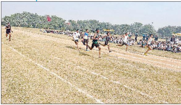
अंबाला। दौड़ प्रतियोगिता में हिस्सा लेते खिलाड़ी व खिलाड़ियों के साथ खेल राज्यमंत्री मंत्री व अन्य।