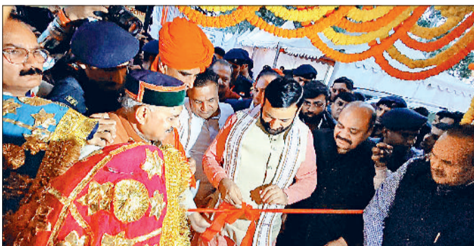
कुरुक्षेत्र। राज्यस्तरीय प्रदर्शनी का उद्घाटन करते मुख्यमंत्री नायब सिंह सैनी।

मुख्यमंत्री नायब सिंह सैनी ने कहा कि हरियाणा प्रदेश गौरवशाली इतिहास के साथ विकासात्मक स्वरूप का प्रत्यक्ष उदाहरण है। जहां गीता की जन्मस्थली पूरे विश्व में ज्ञान का प्रकाश दे रही है, वहीं हरियाणा सरकार की विकासात्मक उपलब्धि देश के अग्रणी राज्यों में हरियाणा को अतुलनीय पहचान दे रही है। मुख्यमंत्री नायब सिंह सैनी बुधवार को अंतरराष्ट्रीय गीता महोत्सव में सूचना, जनसंपर्क एवं भाषा विभाग की राज्यस्तरीय प्रदर्शनी का उद्घाटन करने के उपरांत अपने विचार व्यक्त कर रहे थे। इस दौरान मुख्यमंत्री नायब सिंह सैनी ने राज्यस्तरीय प्रदर्शनी का उद्घाटन किया। इसके उपरांत मुख्यमंत्री नायब सिंह सैनी ने