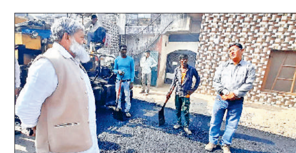
अंबाला। कारपोटिंग के कार्य का मुआयना करते मंत्री अनिल विज।

टांगरी नदी को गहरा करने के लिए तल से मिट्टी निकालने का कार्य फिर शुरू हो गया है। यह कार्य पहले भी शुरू हुआ था लेकिन तब कुछ रुकावटों की वजह से काम बंद हो गया था। मंत्री अनिल विज ने कहा टांगरी नदी तल को आठ फुट गहरा किया जाएगा। 11 फुट का तटबंध बनाया जाएगा ताकि निचले इलाकों में पानी न आए। मंत्री ने बुधवार को चंदपुरा पुल पर टांगरी नदी तल में