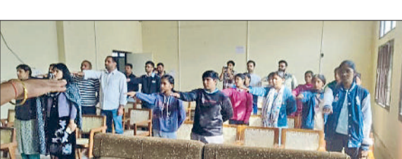
घरौडा। संविधान का पालन करने की शपथ लेते विद्यार्थी