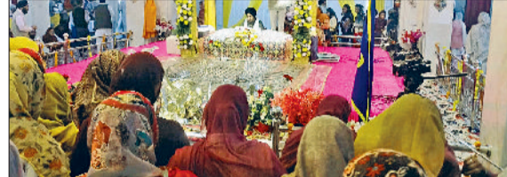
तरावड़ी। गुरुद्वारा साहिब में सजा दरबार व संगत दर्शन करते हुए।

लेकर यहाँ पहुँचे। तरावड़ी के भाई देवा राम धोबी श्री गुरु तेग बहादुर साहिब जी का हाल जानने के लिए उत्सुक था। जब भाई जैता जी यहाँ पहुँचे, तो उन्होंने भाई जैता जी से गुरु साहिब के बारे में पूछा जब भाई देव राम जी को दिल्ली में क्या हुआ था के बारे में पता चला, उन्होंने भाई जैता जी और गुरु साहिब के शीश साहिब को तरावड़ी इस स्थान पर