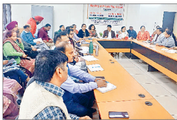
अंबाला। मीटिंग के दौरान मौजूद प्लेवे स्कूल संचालक व अधिकारी।

विद्यालय में बच्चों के शोषण से संबंधित कोई मामला संज्ञान में आता है तो उस तत्काल कार्रवाई करके जिला बाल कल्याण समिति को सूचित करें। बच्चों की