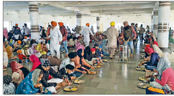
तरावड़ी। गुरु घर में संगत लंगर चखते श्रद्धालु।

जैता जी गुरु साहिब का शीश उठाने में कामयाब हो गए तथा भाई लखी शाह जी गुरु साहिब का शरीर अपने घर ले गए और शरीर का संस्कार अपने घर को आग लगाकर किया क्योंकि सामूहिक तौर पर संस्कार करना खतरं से भरा था। दूसरी तरफ भाई जैता जी गुरु साहिब का शीश