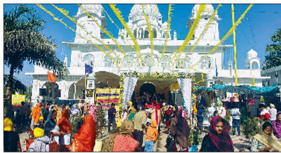
तरावड़ी। गुरुद्वारा शीशगंज शहीदी दिवस पर रंग बिरंगी लाइटों से सजा।